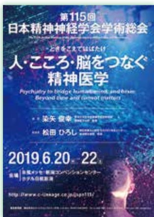
第115回学術総会告知ポスター